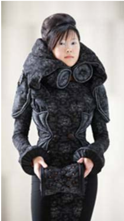
Nederland: Elke Lutgerink - Organic acid (serie van 6)