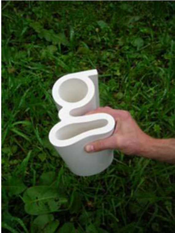
Nederland: gorissendeponi - Zachte G