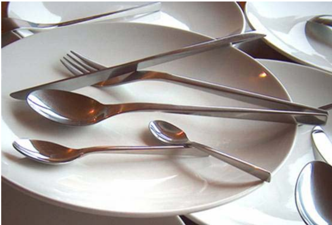
Belgie: Pascal Koch - Stilo